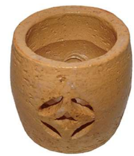
薄茶器 蓋置 大樋素焼七宝