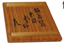
薄茶器 鎌倉彫中棗