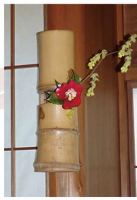
花入 輪無し二重切