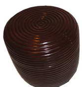
薄茶器 鎌倉彫中棗