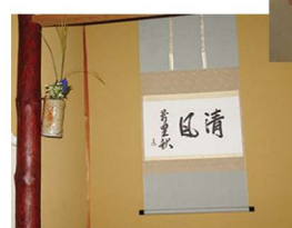
小間での客の作法