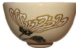
茶碗替 今戸焼秋草