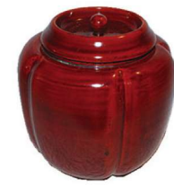
薄茶器 阿古陀茶器