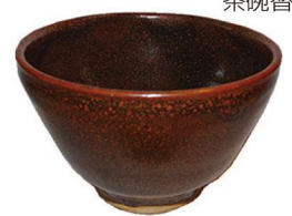
茶碗替 ノルウエー