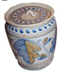
水指 オランダ写したばこ紅毛