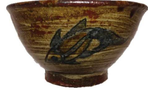
茶碗 替 壺屋焼