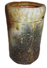
花入 信楽 旅枕