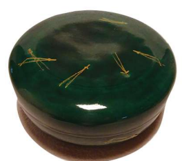
菓子器 松孤軒松葉絵