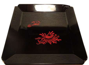
干菓子器 黒四方ミル貝絵