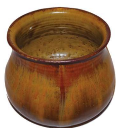
薄茶器 建水 高取 エフゴ