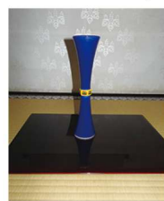
花入 尊式紺青交趾