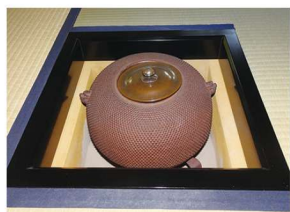
釜 霰 丸釜