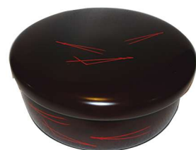
菓子器 溜松葉ヤンボ喰籠