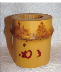
薄茶器 蓋置 竹引切り