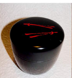
薄茶器 牛書松葉黒大棗