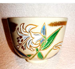
茶碗 替 尾戸焼