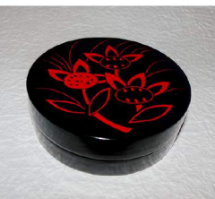
香合 一閑 吉野絵