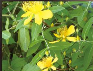
未央柳(びょうやなぎ)