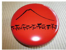
菓子器 不二朱丸食籠