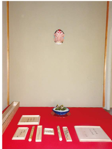
猪嵯峨面・福寿草